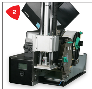
2 Compacto, seguro y de fácil acceso para el usuario.