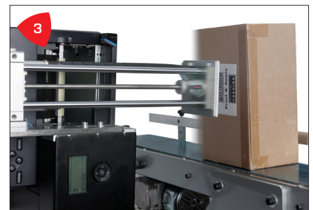
3 Versátil, aplica etiquetas desde arriba, abajo, de forma lateral, en cualquier ángulo de rotación.